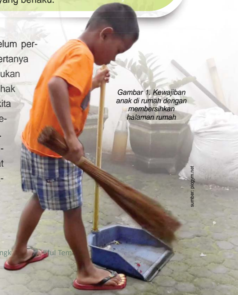
Gambar 1. Kewajiban anak di rumah dengan membersihkan halaman rumah

Sudahkah kita mendapatkan hak-hak kita? Sebelum pertanyaan itu kita ajukan, akan jauh lebih bijak jika bertanya seperti ini terlebih dahulu “Sudahkan saya melakukan kewajiban saya?”. Kita sangat sering menuntut hak namun melupakan kewajiban kita. Untuk itu kita perlu mengetahui benar-benar bahwa kita telah melaksanakan tugas dan kewajiban kita dengan baik. Kewajiban yang harus kita lakukan di sepanjang hidup di mulai dari lingkungan terkecil dan terdekat dari kita yaitu rumah atau keluarga, berikutnya adalah di satuan pendidikan dan di masyarakat. Coba Anda perhatikan gambar-gambar berikut ini.